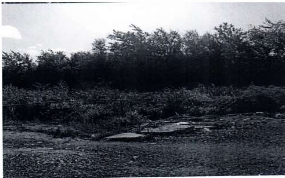
ФОТО 3 и ФОТО 4