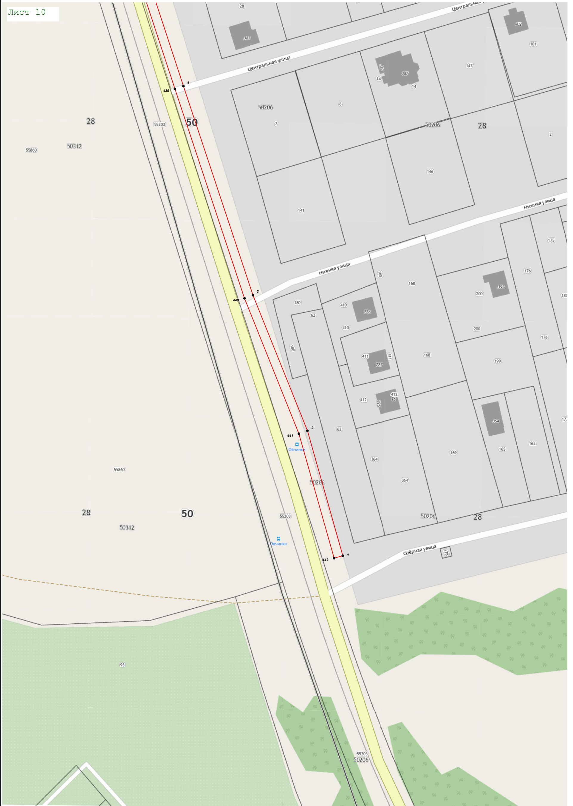
Масштаб 1:1 000