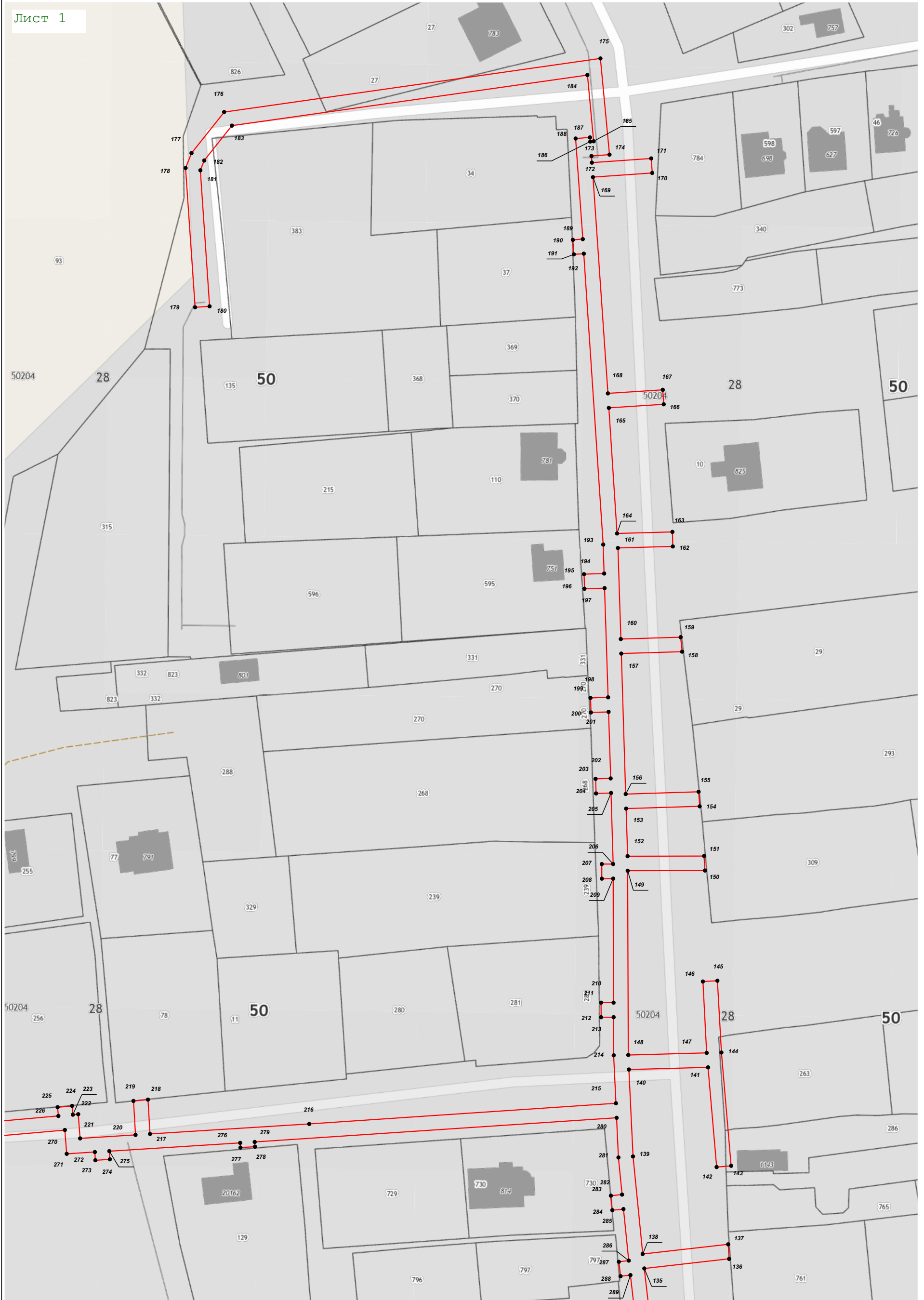
Масштаб 1:1 000