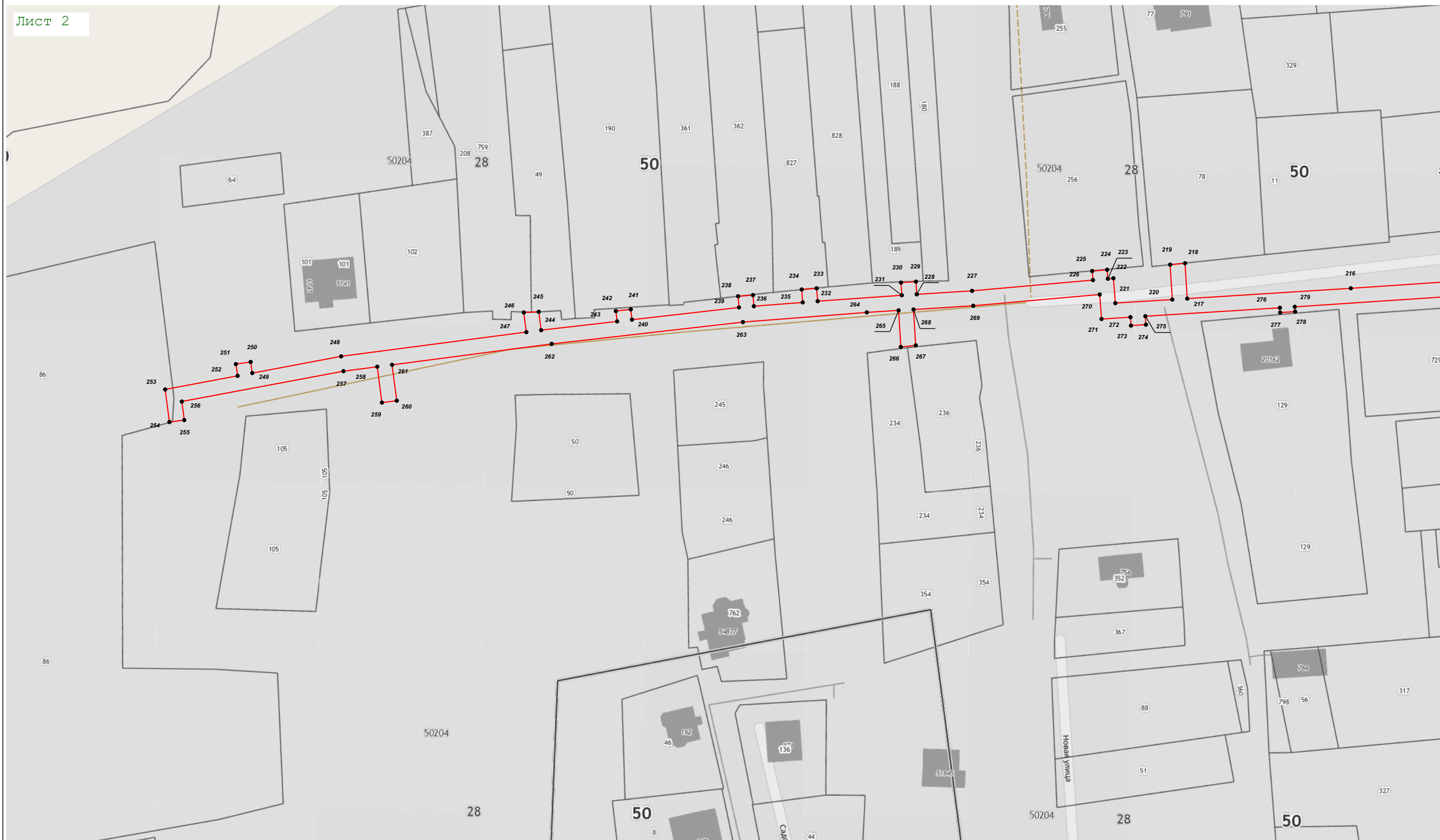
Масштаб 1:1 000